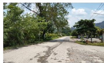
ทางหลวงหมายเลข 1115