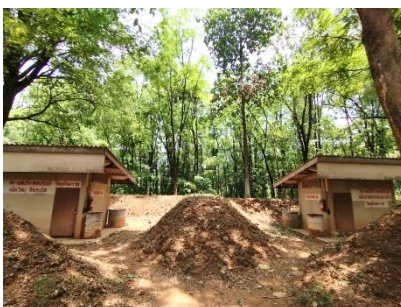
อาคารเก็บวัสดุระเบิด