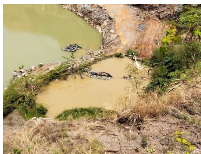
บ่อดักตะกอน