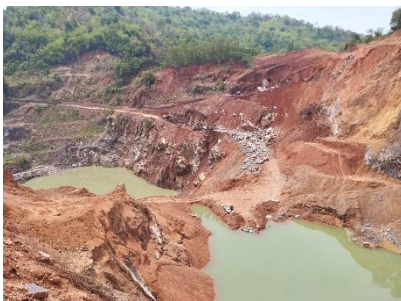
พื้นที่หน้าเหมือง