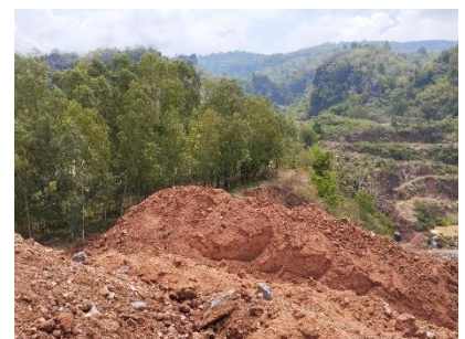
พื้นที่เก็บของเปลือกดิน