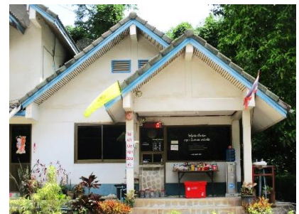
สำนักงานโครงการ