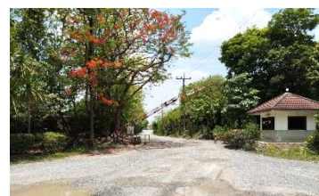
บริเวณด้านหน้าทางเข้า-ออก พื้นที่โครงการ