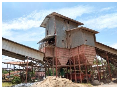
โรงโม่หินของโครงการ